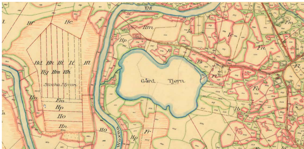
Karta från laga skifte, sent 1800-tal