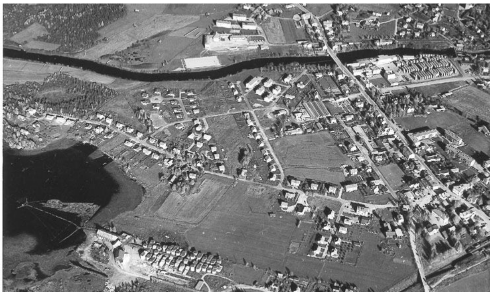
Gammal flygbild (före 80-talet) där den del av Gårdtjärn där förbindelsen enligt vissa källor ska ha funnits framgår.

Man kan således konstatera att det nog finns delade meningar om huruvida en förbindelse med Voxnan åt norr har funnits eller inte och även om det vore tillfredsställande att ha ett absolut svar, så är det i dagsläget mycket intressantare att i stället lägga tid och energi på att titta framåt för att se hur Ovanåkers kommun skulle kunna hjälpa till att förbättra vattenkvaliteten samt stärka Gårdtjärns värden.