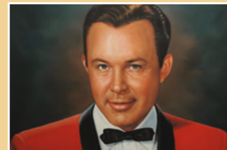
Original Jim Reeves oljemålning på museet.