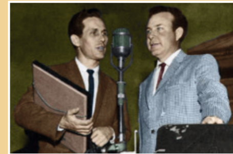
Chet Atkins och Jim Reeves.