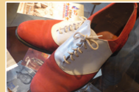
Jim Reeves bowling skor på museet i Voxna.