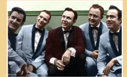
Jim Reeves and The Blue Boys.