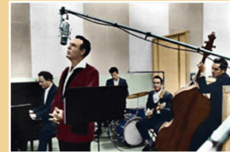
Jim Reeves and The Blue Boys.