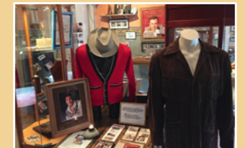
Interiör från museet i Voxna.