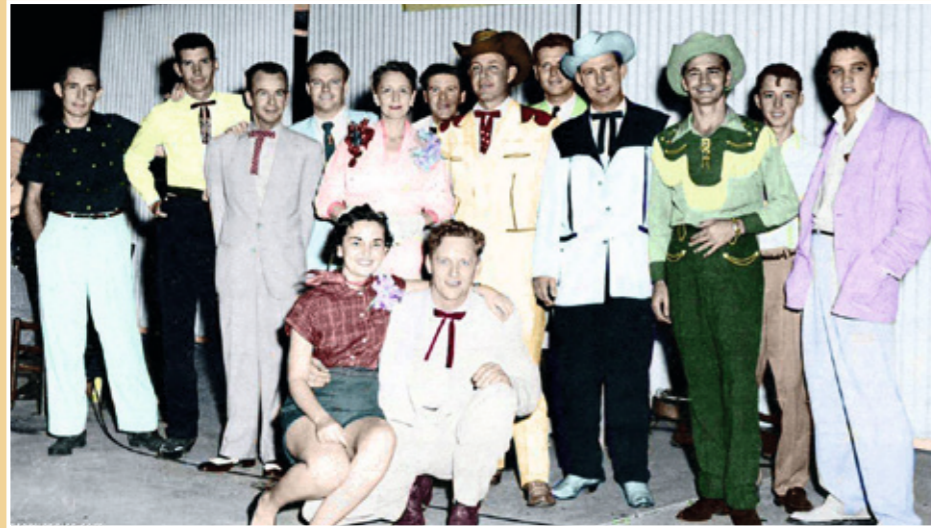
Jim Reeves (mitten) och en ung Elvis Presley (längst till höger). 1 september 1955 på Louisiana Hayride.

Jim Reeves museum är öppet alla dagar under juli månad 11-16.00